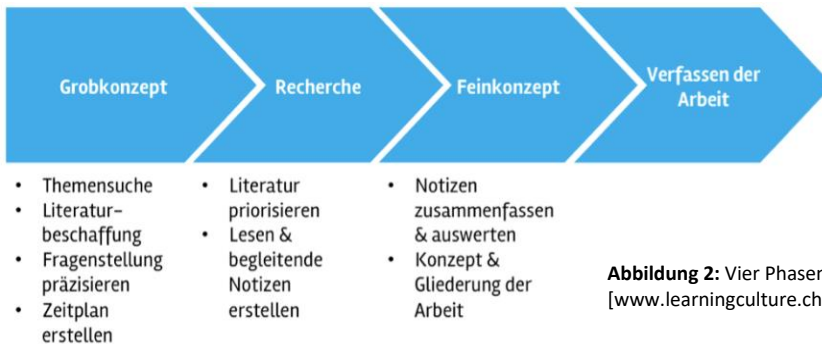
Abbildung 2: Vier Phasen bei der Erstellung einer Arbeit (15.08.16); [www.learningculture.ch]

Im Quellenverzeichnis steht die gesamte Bildquelle, die sich u. U. über mehrere Zeilen erstrecken kann.